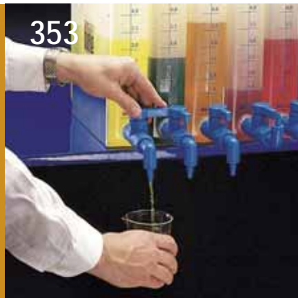
350. Kraftiga dunkar av polyeten med hål för kranar av typerna 636.33, 636.43 samt 525.293.