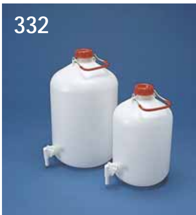
332. Flaska PEH kraftigt gods med fast kikkran