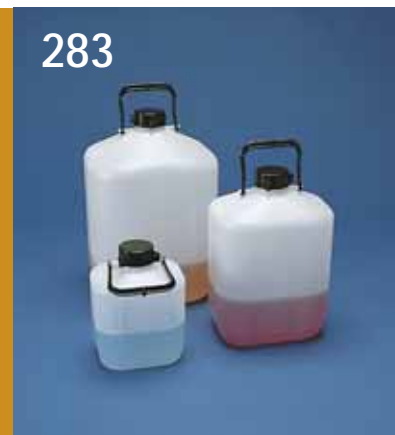
283. Flaska PEH rektangulär