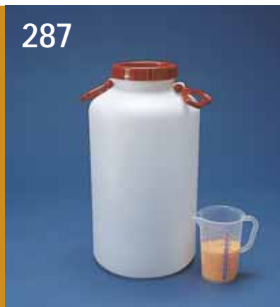
287. Flaska PEH vid hals, mycket kraftigt utförande