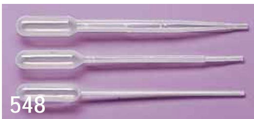
548. Pasteurpipett, PE