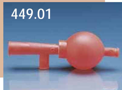
449.01 Pipettsug Universal, naturgummi, passar alla pipetter