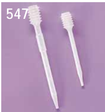
547. Pipett, PE, bälgmodell