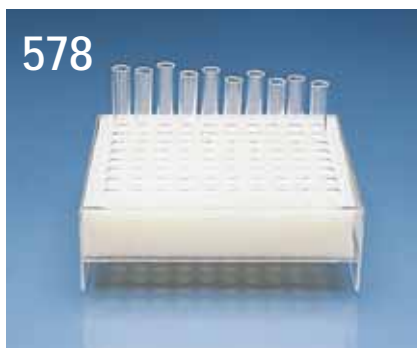
578.80 Provrörställ, PMMA med skumgummi grepp för 80 rör 75x12 mm