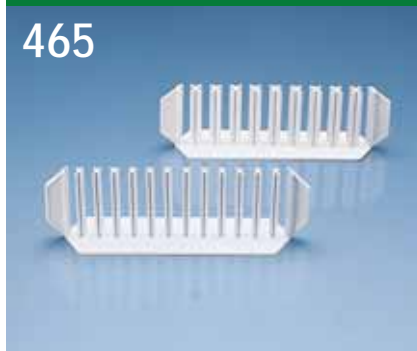
465. Provrörställ av PEH