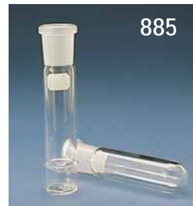
885. Provrör av borosilikatglas Duran, kraftiga, med NS-hylsa och med skrivfält